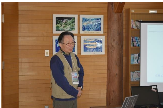
講義型研修① 『エコツーリズム概論』