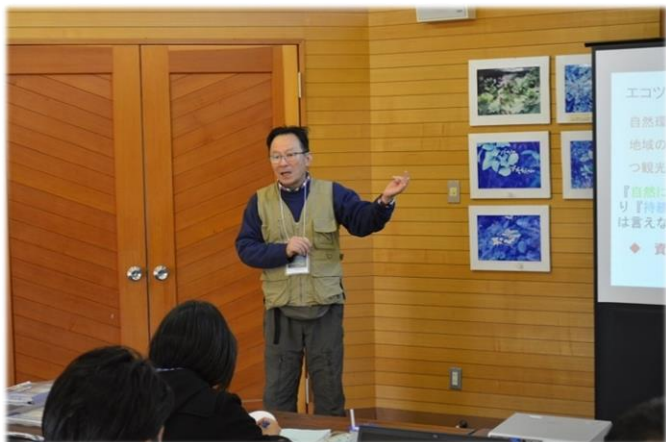
講義型研修① 『エコツーリズムについて』