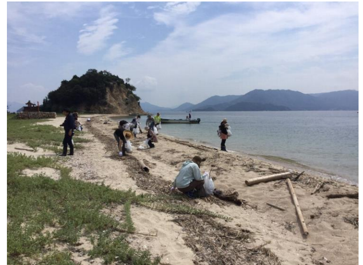
腰細浦で海浜清掃