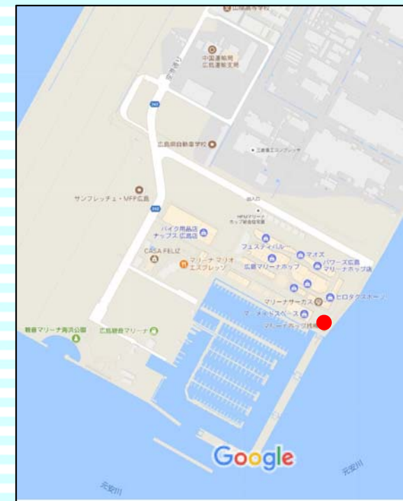
マリーナホップ(広島県側)